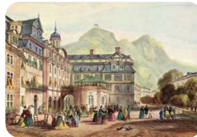
Kurpromenade um 1850 Lithografie von George Barnard