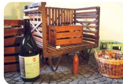
Emser Kräunchen In Mineralwasserkrügen gelangte das Heilwasser in alle Welt

Balkleid und Küchenschürze – Leben im Kurort