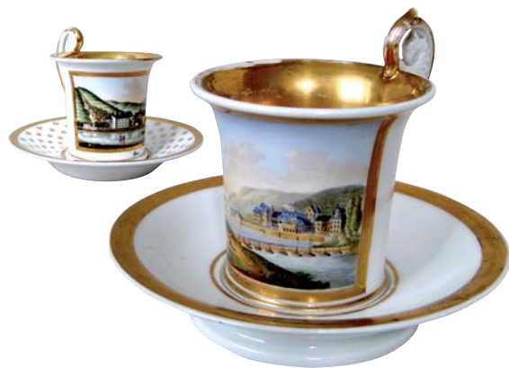
Bad Ems Schmucktassen mit Ansichten von Bad Ems

Im prachtvollen Kursaal begeisterten Jacques Offenbach, Clara Schumann und Franz Liszt das internationale Publikum.