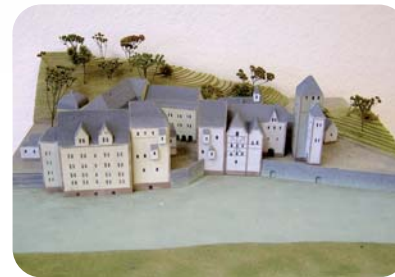
Das Emser Bad um 1600 Modell